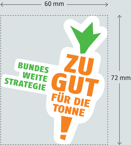
Logo 100 % inklusive Schutzzone

Von dieser Größe ausgehend wird das Logo für die verschiedenen Papierformate wie in der Tabelle vorgegeben prozentual verkleinert bzw. vergrößert. Größer als in der Tabelle beschrieben darf das Logo abgebildet werden, nicht jedoch kleiner.